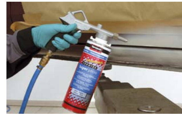
Terotex-Super 3000 Jasny