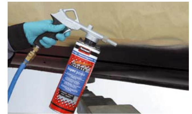
Terotex-Super 3000 Czarny